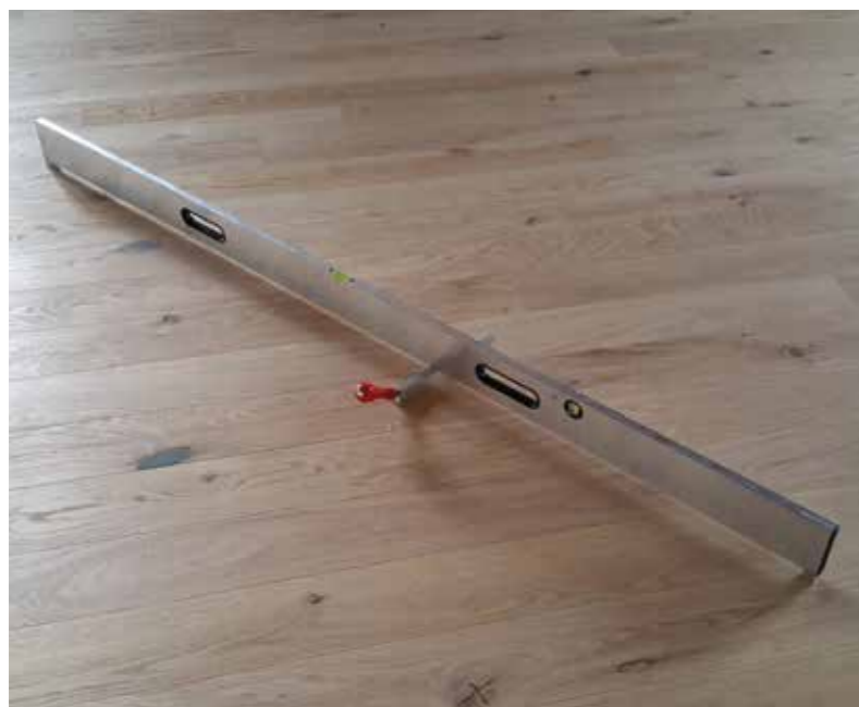
● Měření nerovnosti 2MLK – správně

Ted' nastražte uši nebo spíš: pozorně čtěte. Odchytky místní rovinatosti se stanovují pomocí dvoumetrové latě. Na jejích koncích jsou podložky o půdorysné ploše 10×10 mm až 20×20 mm. Výška podložek se zvolí podle potřeby. Pomocí odměrného klínu se změří maximální a minimální vzdálenost mezi povrchem vrstvy a spodním lícem latě.