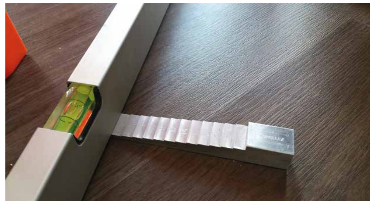
● Měření nerovnosti 2MLK – špatně

Výška odměrného klínu ( sklon ) se zvolí podle potřeby.