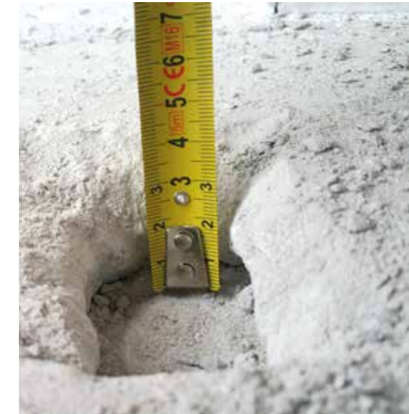
● Odběr anhydritu od spodu

...Většina podlahářů ji bohužel podceňuje!