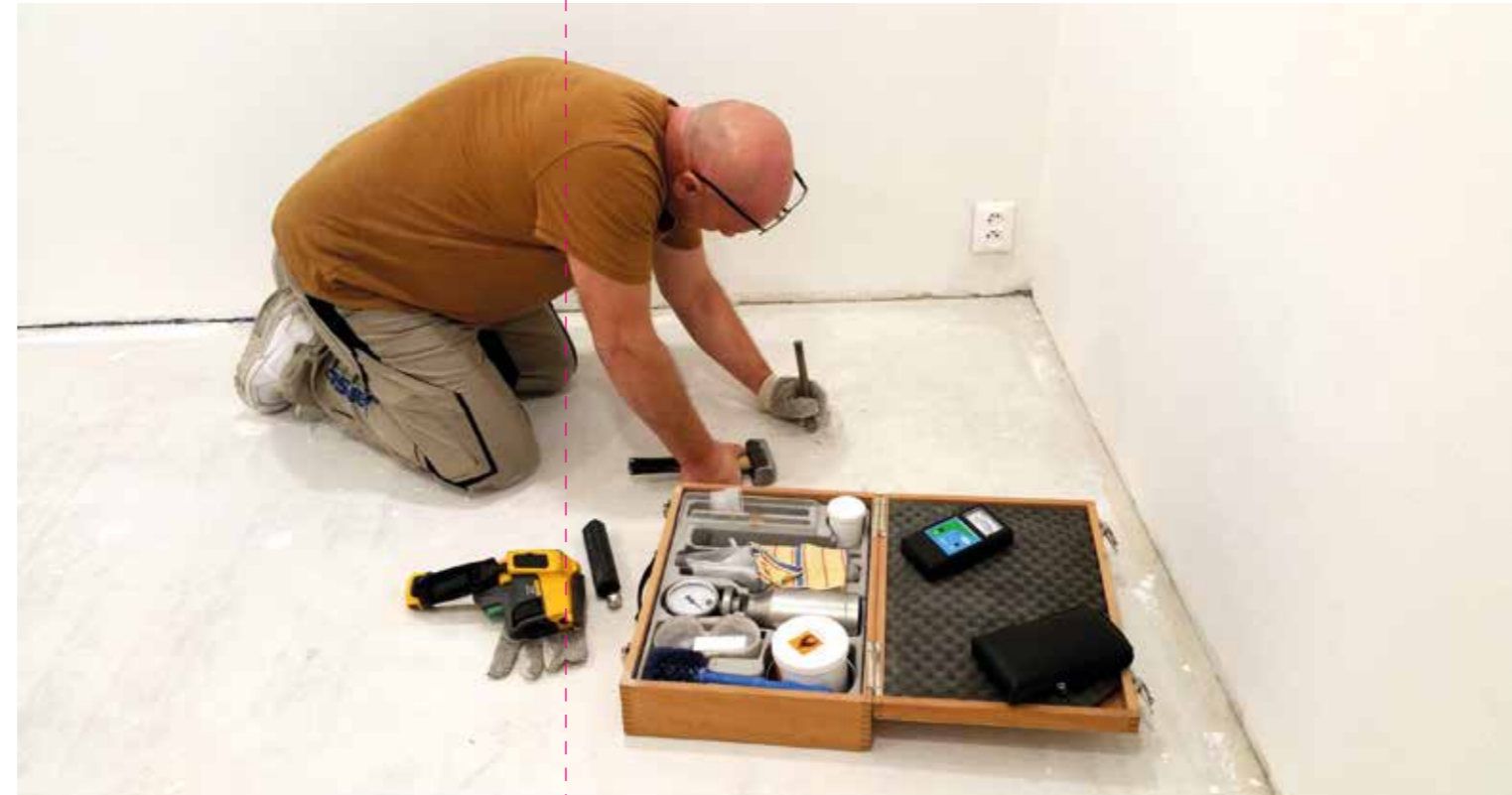
● Měření zbytkové vlhkosti

↓ Bylo to rozčarování. Hodnoty naměřené CM přístrojem překročily trojnásobek povolené hodnoty pro pokládku podlah. To se může stát nejednomu podlaháři, pokud