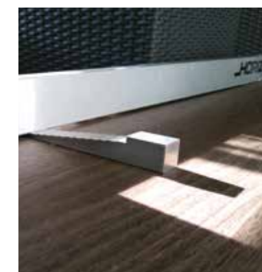
● Měření nerovnosti 2MLK – špatně