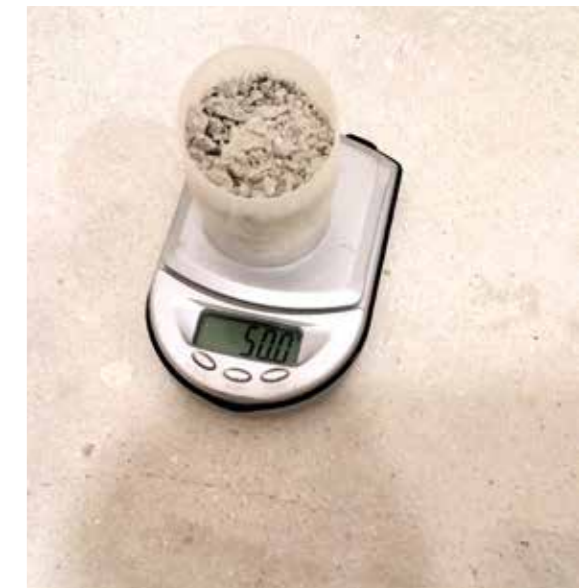
● Odměřeno 50 g anhydritu

↓ Veškeré hodnoty jsou popsány v ČSN 744505. Tuto normu by měl znát každý podlahář z paměti. Ale tak tomu ve většině případů není.