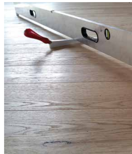
● Měření nerovnosti 2MLK – správně

vají odměrný klínek, na kterém je stupnice 1 mm. Klínek zasouvají pod lať a tam odečítají nerovnosti. Tato metoda měření je ale už od roku 2012 passé.