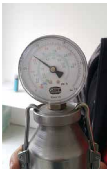
● Naměřená hodnota překročena 3x

V případě podlahového vytápění snižte hodnoty o 0,2 %.