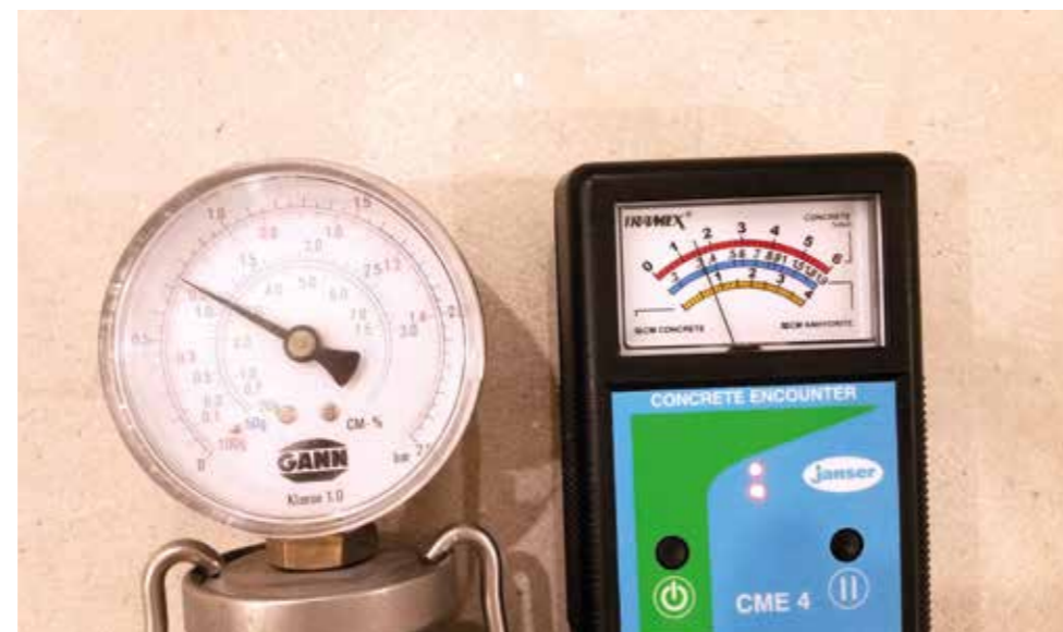
● Porovnání měřících přístrojů